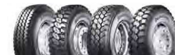
M840 EVO L355 EVO M748/M748 EVO L317 EVO

Paras suorituskyky tiellä ja Off-road-olosuhteissa Bridgestonen On/Off-mallistolla