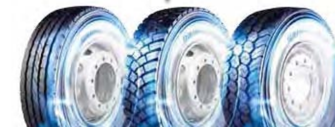
M-STEER 001 M-DRIVE 001 M-TRAILER 001

Valitkaa M840 EVO, L355 EVO, M748 ja M748 EVO